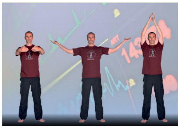
Erst wenige Jahre bekannt: HerzKreis-Training.

Ein Beispiel, wie Sie Ihr Herz täglich stärken können: Konzentrieren Sie sich für einen Moment auf Ihr Herz. Hören oder spüren Sie, wie es schlägt? Merken Sie, wie es das Blut durch Ihren Körper pumpt und ihn damit mit lebenswichtigen Stoffen versorgt? Werden Sie sich bewusst, dass ihr Herz jeden Tag unaufhaltsam für Sie arbeitet und bedanken Sie sich bei ihm. – Spüren Sie,